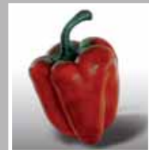
HORTENSE DE KOOTER